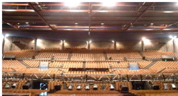
Configuration assise pour 4 500 personnes

Le Zénith a été conçu pour accueillir les plus grands événements : concerts mais aussi manifestations sportives (boxe, spectacles équestres, etc....), conventions, jumbo congrès de plus de 3 000 personnes, lançements de produits ou dîners de gala...Le Zénith possède une capacité de 4 500 places assises ou 7000 en configuration assis/debout et dispose de 500 à 800 m 2 de scène et d'un parterre de 3200 m 2 .